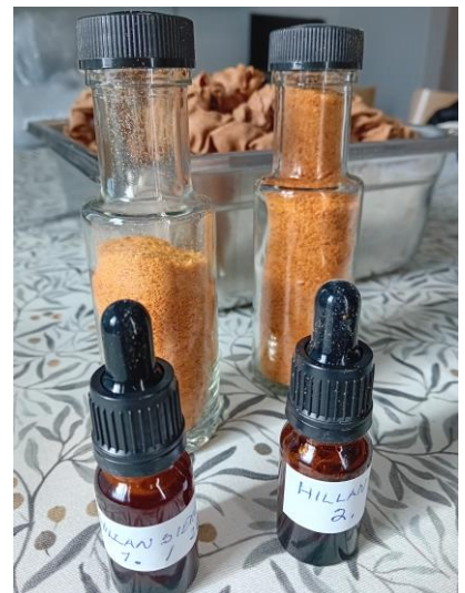
Työpajassa kokeiltiin hillansiemenöljyn mekaanista puristamista.