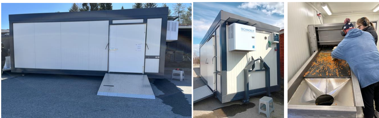
Marjanravistinkontti on saapunut Louelle ja sitä testataan tyrnin ravistamiseen.

Marjanravistuskontti on suunnitellusti saatu käyttöön toukokuussa. Marjanravistin soveltuu esimerkiksi tyrnin irrottamiseen oksista. Aikeissa on kokeilla myös muiden paikallisten raaka-aineiden käsittelyä. Marjanravistinkonttia onkin päästy testaamaan toukokuun puolivälin jälkeen Louella. Ilmoitamme hankeverkostolle heti, kun demopäivän järjestäminen on ajankohtaista!